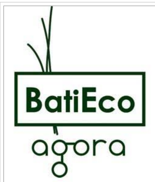
BatiEco Agora 2009

PR Agentur: NEWSBROKER® Public Relations